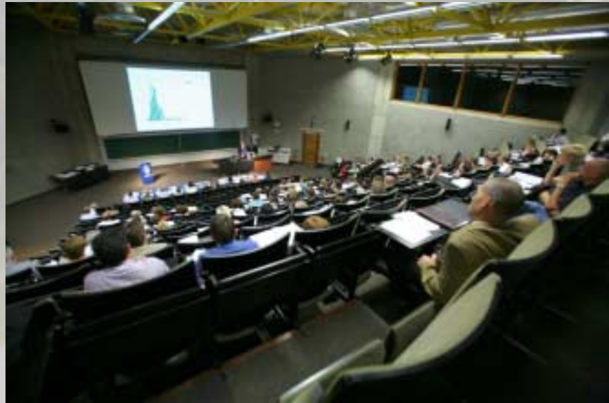
150 deelnemers uit ziekenhuizen, revalidatiecentra en thuiszorg volgden alle presentaties en de uitreiking.