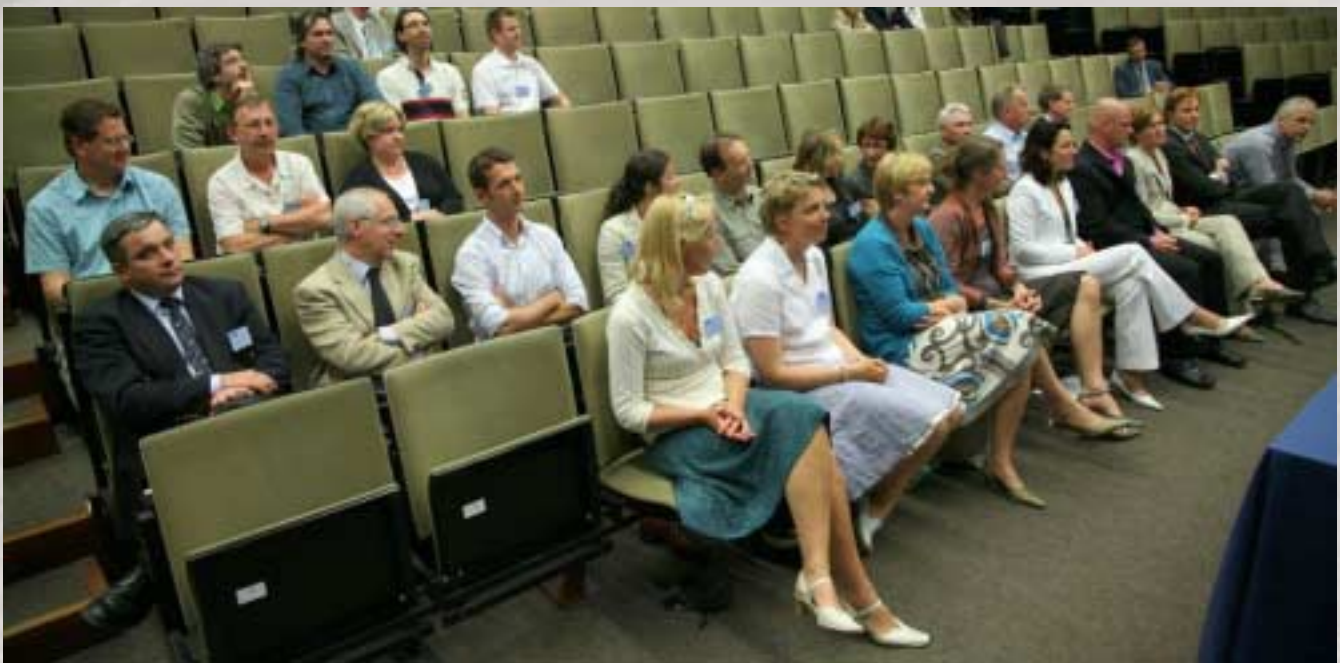
De vertegenwoordigers van de deelnemende teams.

De foto's zijn beschikbaar via www.nkp.be